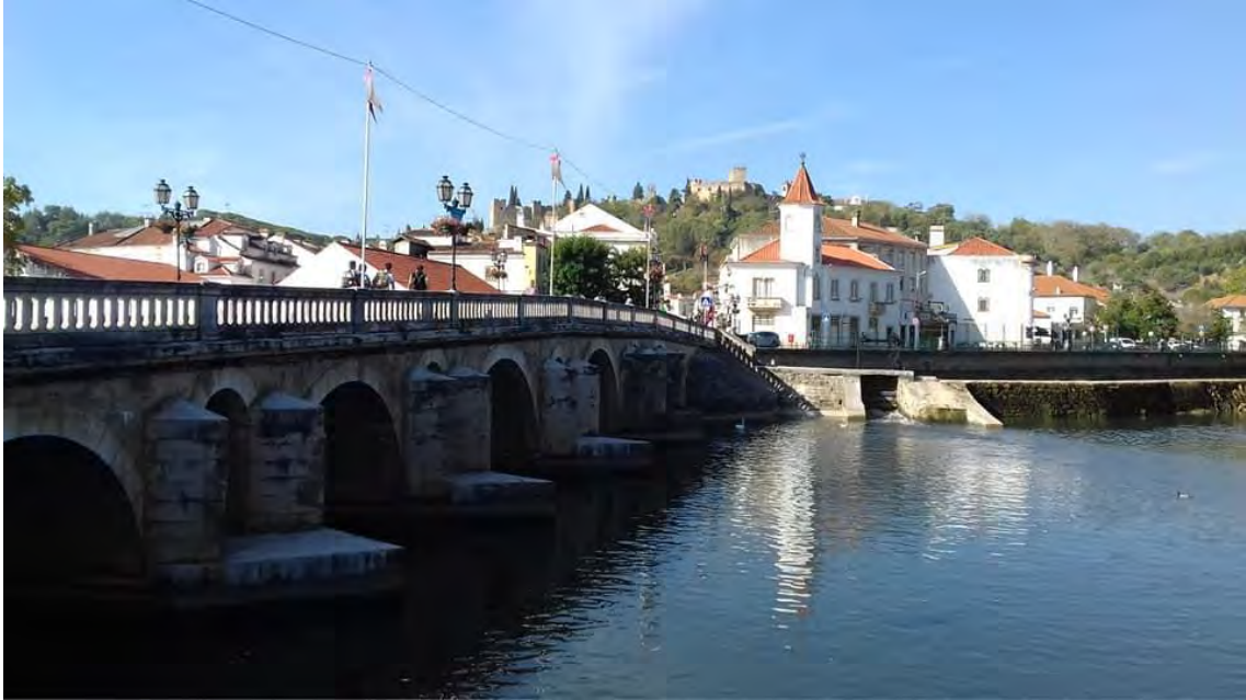
Nabão-joen varrella sijaitseva Tomarin kaupunki tunnetaan muun muassa hyvistä viineistään ja ikivanhasta temppeliherrojen ritarikunnan linnaluostaristaan.