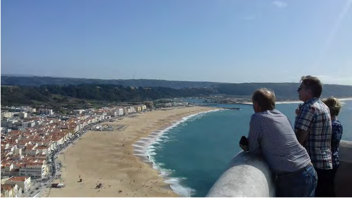
Nazaré on huikeiden näköalojen ja herkullisten kalaruokien paikkakunta Atlantin rannalla.